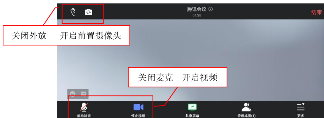
图 2 腾讯会议第二机位设置图

第二机位采用手机的，开启手机屏幕“自动转转”功能，手机横屏拍摄。腾讯会议相关设置结果如图 2 所示。