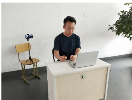
图 1 考生双机位设备摆放布置示意图

双机位拍摄画面显示完整的考生复试环境，即双机位两台设备同时开启摄像头，第一机位（电脑）摄像头对准考生本人从正面拍摄（要保证第二机位手机屏幕能被复试专家看到），第二机位（手机）摄像头从考生侧后方 45° 拍摄（要保证考生第一机位电脑屏幕能被复试专家组看到），考生双机位设备摆放布置示意图如图 1 所示。