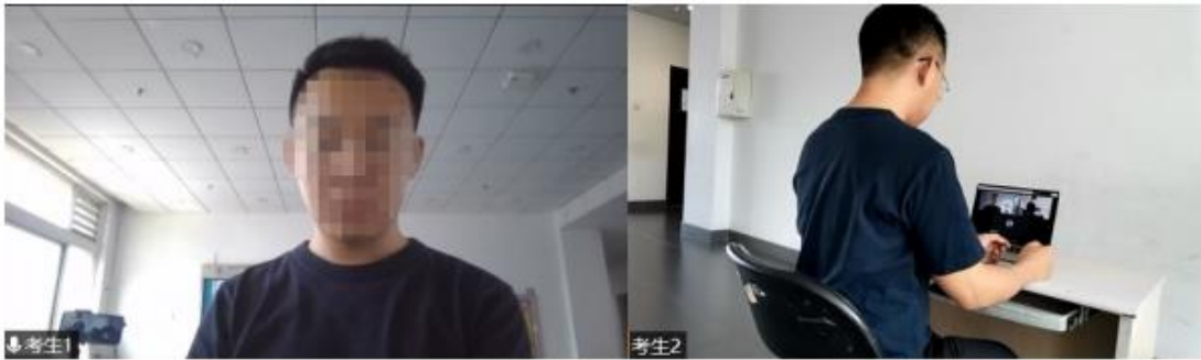
图1 考生双机位设备摆放布置示意图

4、软件要求： 要求双机位两台设备提前安装“腾讯会议”和“腾讯QQ”两个软件，熟练操作。 考生需注册两个“腾讯会议”账号，分别通过双机位两台设备同时加入“腾讯会议”。