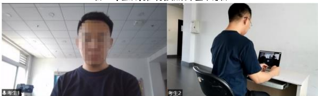
图 2 双机位镜头显示的考生画面

4、软件要求： 要求双机位两台设备提前安装“腾讯会议”和“腾讯 QQ”两个软件，熟练操作。考生需注册两个“腾讯会议”账号，分别通过双机位的两台设备同时加入“腾讯会议”。